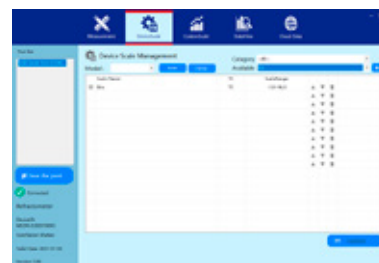
Software fornito con il DBR 95, per il controllo remoto e l'inserimento di scale personalizzate