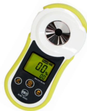
DBR 55 / SALT